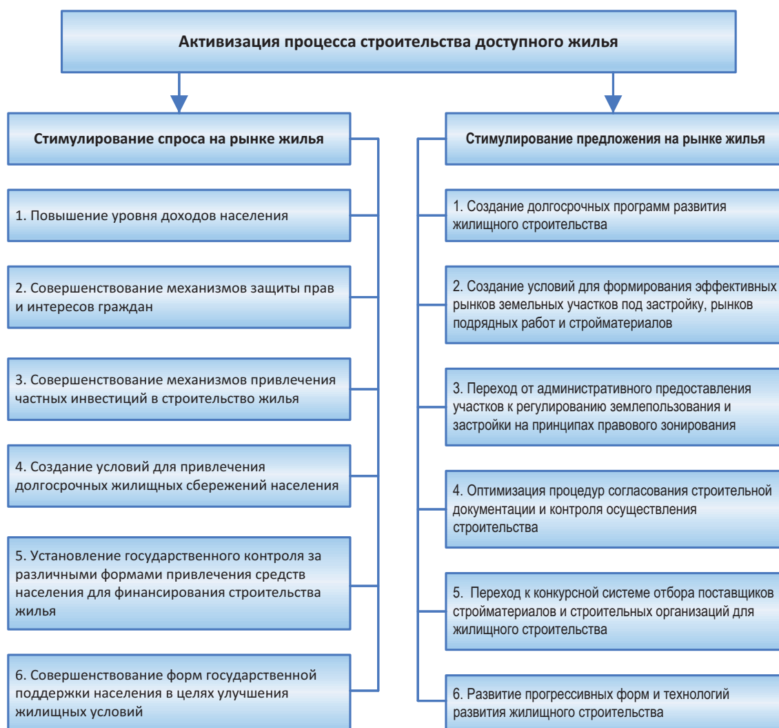
Рисунок 2. Пути решения жилищной проблемы

Однако при учёте реальных доходов семьи за вычетом прожиточного минимума продолжительность накопительного периода увеличивается соответственно до 8,7 и 9 лет. Следует отметить также, что за 2008 – 2009 гг. жильё на первичном рынке стало более доступным, чем на вторичном (табл. 6).