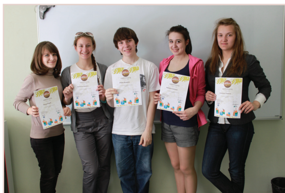
Школьная компания «TrustCane» с сертификатами «Эстафеты социальных инноваций»

Все участники команды «TrustCane» успешно прошли международный тест в рамках «Эстафеты социальных инноваций» и получили сертификаты, а также дипломы финалистов конкурса.