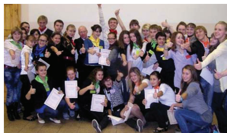
В инновационном лагере