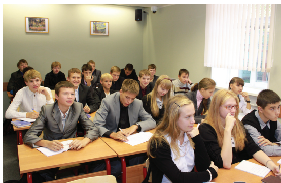
На уроке экономики

В рамках курса «Региональная экономика» будут рассмотрены следующие темы: «Промышленность Вологодской области», «Сельское хозяйство Вологодской области», «Торговля и сфера услуг Вологодской области», «Экономика туризма», «Экономика образования», «Экономика здравоохранения», «Развитие инновационной деятельности в регионе».