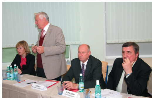
На пленарном заседании

«На конференции были представлены результаты не только теоретических научных исследований, но и краткий обзор практической ситуации в сфере туристских услуг.