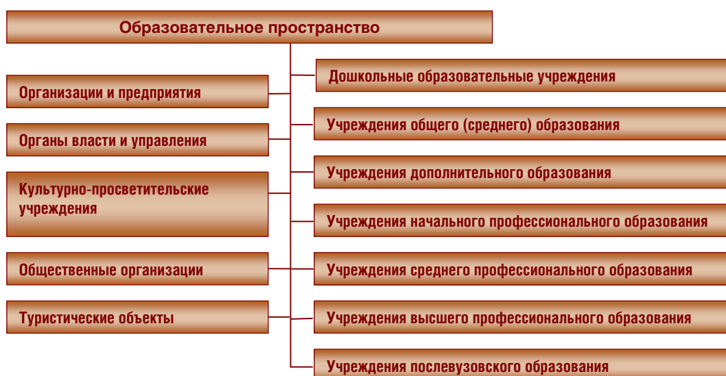
Рисунок 1. Структура образовательного пространства