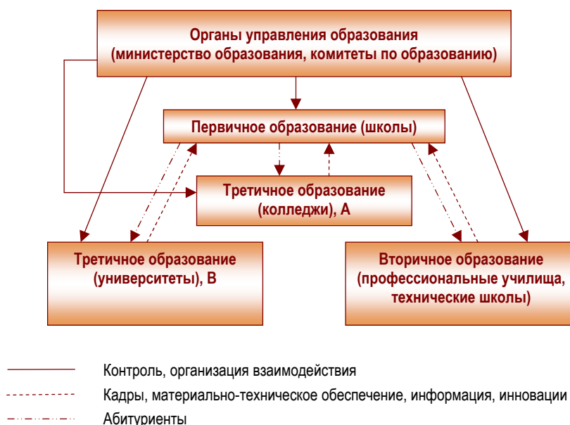
Рисунок 2. Взаимодействие субъектов образовательного пространства в зарубежных странах

Источники: Актуальные вопросы развития образования в странах ОЭСР. – М., 2005; Исмаилов Э.Э. Довузовская профессиональная подготовка в Швеции // Педагогика. – 2004. – № 6. – С. 74-78.