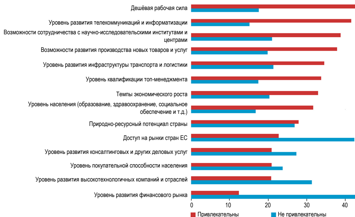
Рисунок 3. Распределение противоположных оценок экономических факторов инвестиционного климата Беларуси в 2008 г., в % [4]

консультантов и специалистов, которые должны оказать помощь инвесторам. В первую очередь, потенциальному инвестору требуются услуги по подбору проектов по критериям, которые для него важны; экспертизе проекта на целесообразность, эффективность, надёжность и реализуемость; оценке рисков проекта, выявлению его плюсов и минусов; получению прочей информации, необходимой для принятия решения; а также помощь в переговорах с инициатором проекта для получения более выгодных условий участия в проекте; консультации по формам и стратегии инвестирования, положению дел в стране и отрасли, альтернативным вариантам и проектам и др. Благодаря такой поддержке, в частности, российских инвесторов качество реализации инвестиционных проектов в Беларуси будет расти.