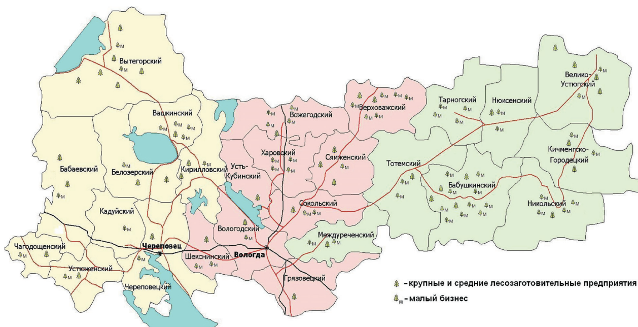
Рисунок 1. Размещение лесозаготовительных производственных мощностей в лесозаготовительных зонах Вологодской области, 2008 г.