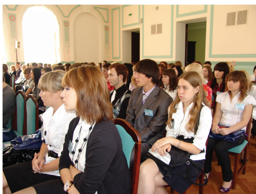
Первокурсники в Областной библиотеке