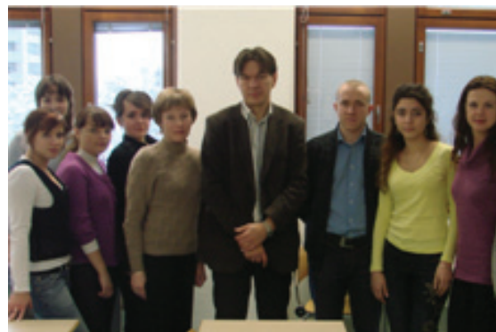
Студенты ИНЖЭКОНа в Финляндии