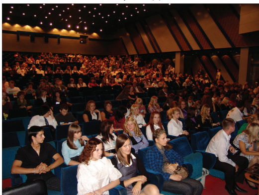
На концерте в ДК ПЗ