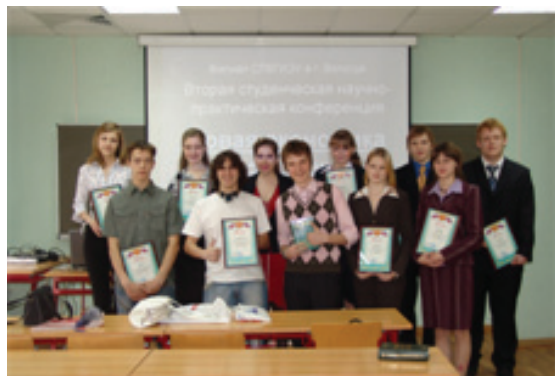
Лауреаты конференции «Новая экономика – новое общество»