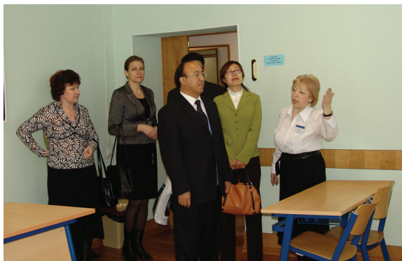
Гости из Китая

В планах филиала – развитие международного сотрудничества. Филиал активно сотрудничает с Университетом прикладных наук Кюменлааксо финского города Коуволы.