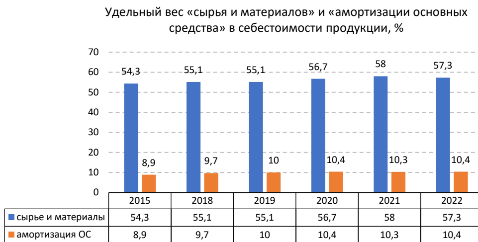
Рис. 2. Динамика изменений доли отдельных компонентов в структуре затрат, %

2. При отрицательном сальдированном финансовом результате (прибыль минус убыток) рентабельность проданной продукции является отрицательной. Эта вторая тенденция характерна для группы регионов, в которую входят 13 субъектов РФ: республики Тыва, Алтай, Чеченская и Карачаево-Черкесская, Самарская, Сахалинская, Магаданская, Мурманская области, Приморский, Хабаровский края, ХМАО, ЯНАО, Еврейская автономная область. Причины получения по финансово-экономическим показателям отрицательных значений являются типичными для всех регионов (см. первую и третью тенденции), однако на их параметры существенное влияние оказывают природно-климатические условия, объемы производства и потребления продукции, состав и номенклатура себестоимости и прочие обстоятельства, отражающие специфику развития региона и особенности ведения животноводства в разных субъектах РФ. С социо-эколого-экономической точки зрения подобная ситуация приводит к аналогичным выводам, что и при анализе первой