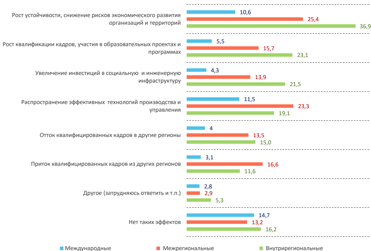
Рис. 2. Эффекты кооперационно-сетевых связей предприятий для социально-экономического развития Алтайского края, % ответов руководителей предприятий