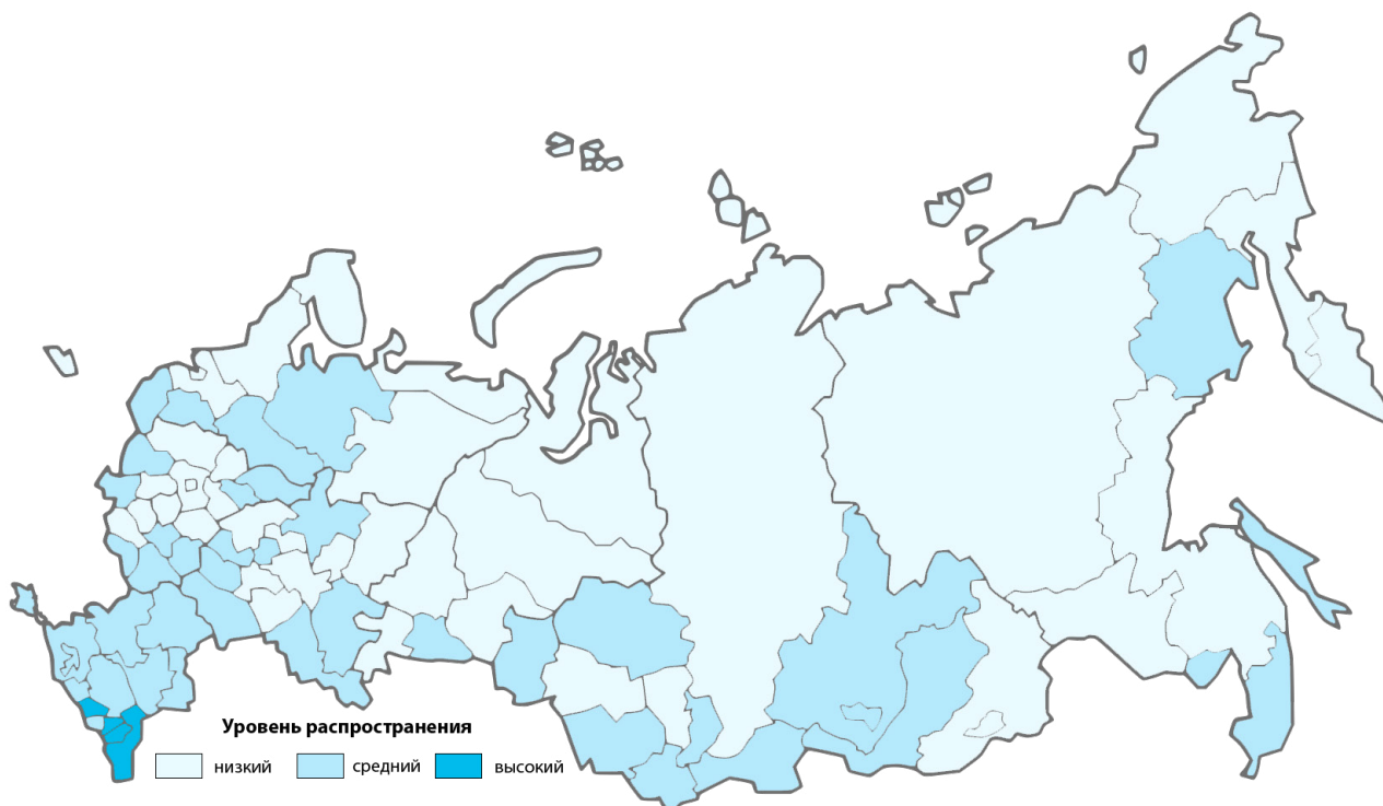
Рис. 3. Уровень распространения занятости в неформальном секторе в субъектах РФ, 2019 год

Весьма противоречивой представляется ситуация с занятостью в неформальном секторе, если обратиться к региональному опыту. Так, в 2019 году ее уровень варьировался от 4% в г. Москве до 62% в Чеченской Республике, из чего следует, что в одних субъектах данный феномен крайне редко встречается на практике, а в других – к нему прибегает около половины всех работников. Вместе с тем расчет коэффициента вариации свидетельствует о наиболее однородном распределении территорий среди обозначенных в статье индикаторов (41%). Причины этого могут заключаться в особенностях социально-экономического развития страны, которые не только препятствуют формализации малого предпринимательства [15, с. 30–31], но и способствуют сохранению широкой «прослойки» самозанятых, вынужденных хоть как-то зарабатывать себе на жизнь [16, с. 26], что особенно актуально в условиях ухудшения материального благополучия населения в последние годы 16 .