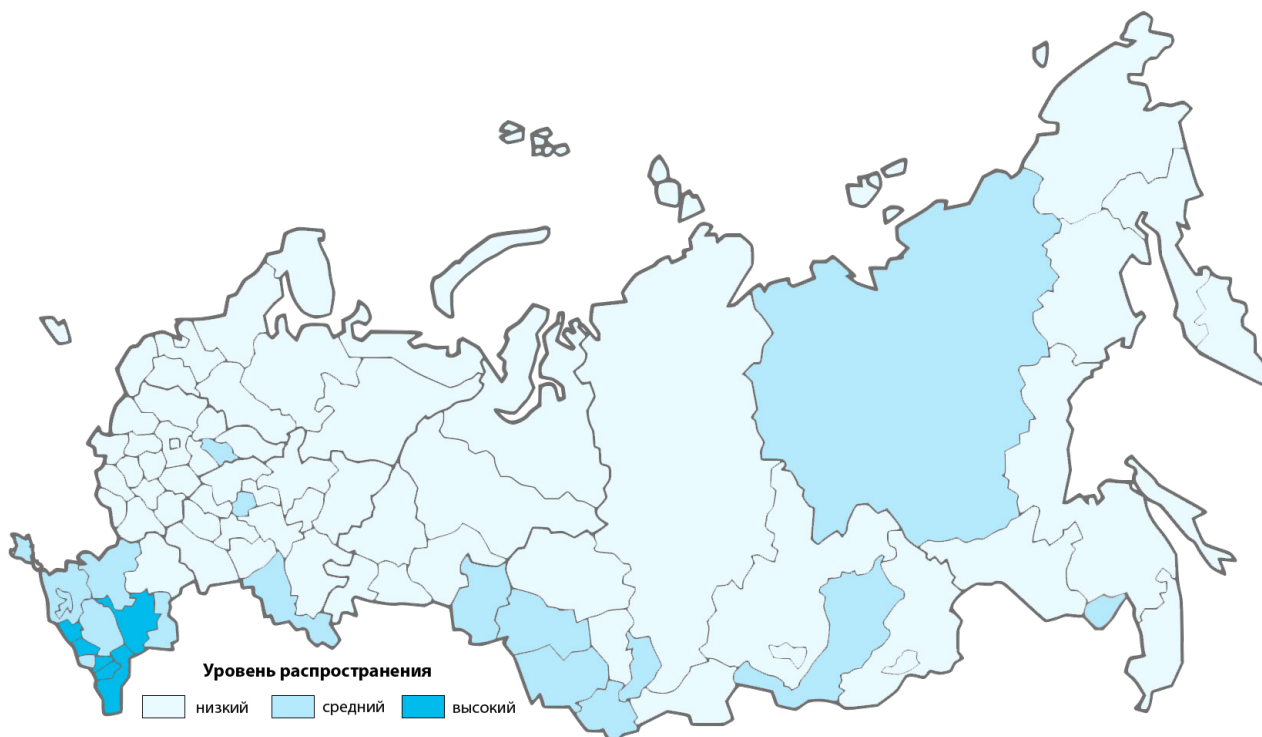
Рис. 6. Уровень распространения занятости не по найму в субъектах РФ, 2019 год