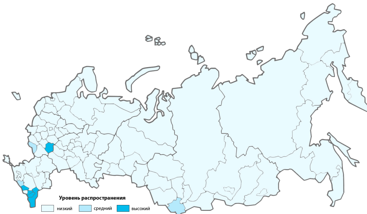
Рис. 5. Уровень распространения занятости в ЛПХ в субъектах РФ, 2019 год

тематика не пользуется особым интересом в современных научных работах, поэтому сведения о ее специфике представлены весьма скудно.