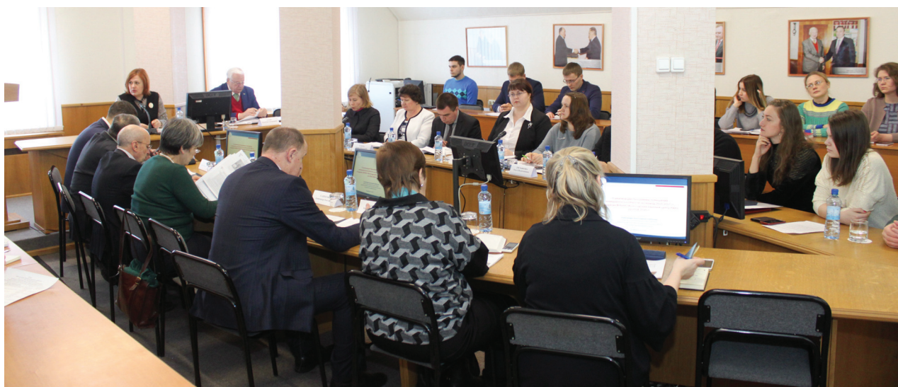
Заседание ученого совета ФГБУН ВолнЦ РАН 26.02.2018