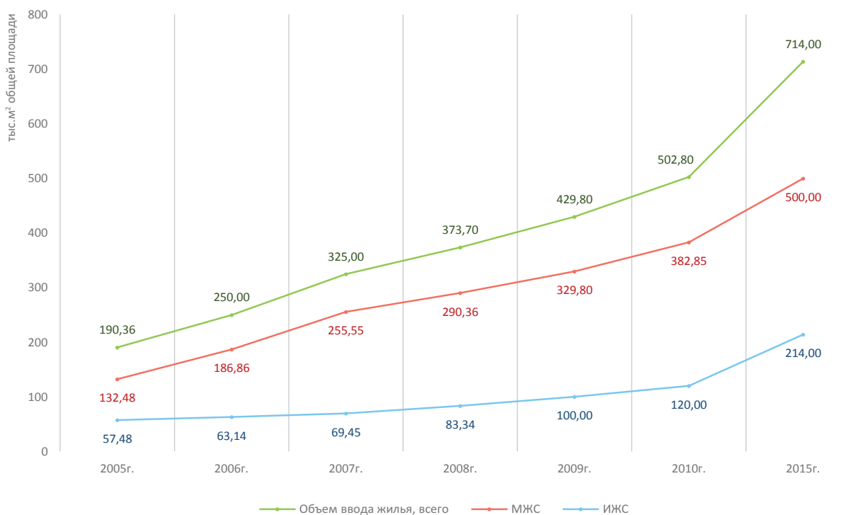
Рис. 1. Развитие жилищного строительства в г. Пензе

Практически весь объем предложения приходится на объекты эконом- и среднего классов, доли которых в общем объеме предложения составляют 66,1% и 32,7% соответственно [12; 14]. На 1-й квартал 2015 года в стадии строительства нахо-