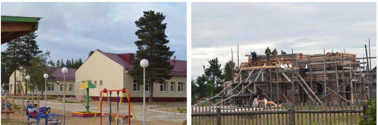
Рис. 2. Черты благополучия в селе