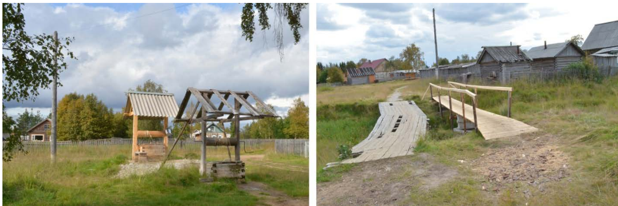
Рис. 4. Символы «старого» и «нового» в жизни села