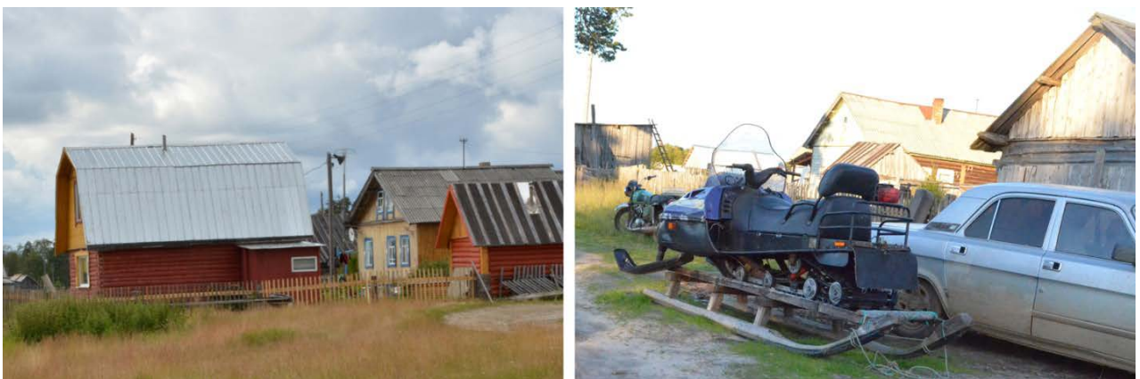
Рис. 3. Черты благополучия в селе

альному проекту строится бревенчатый православный храм (рис. 2). Работают три магазина, в которых представлен достаточно широкий ассортимент продовольственных и промышленных товаров.