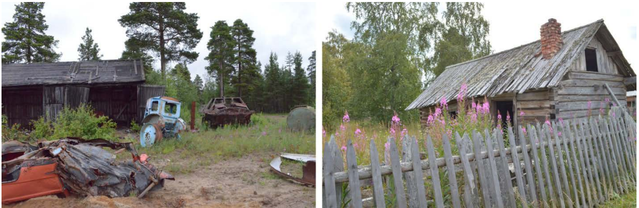
Рис. 1. Черты разрухи в селе