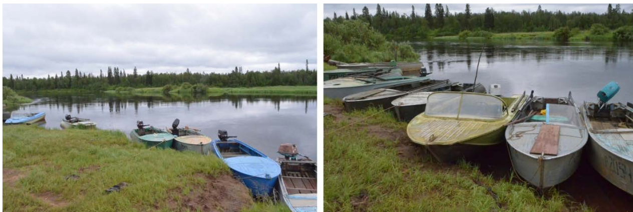
Рис. 5. На реке Поной

Проблема занятости жителей села оказалась сложной для обсуждения. Информанты неохотно разговаривали на эту тему и жаловались на то, что постоянной стабильной работы, приносящей доход, в селе не хватает. Поэтому, по их словам, значительная часть населения вынуждена заниматься временными подработками и различной инициативной деятельностью, которая помогает выживать. Важное место в такой деятельности принадлежит традиционным видам занятости коренного населения Севера: оленеводству, рыболовству и сбору ягод.